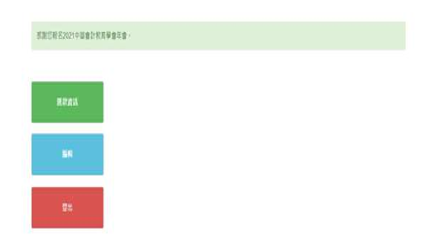
Step 5 This Screen Appears to Complete the Online Registration.